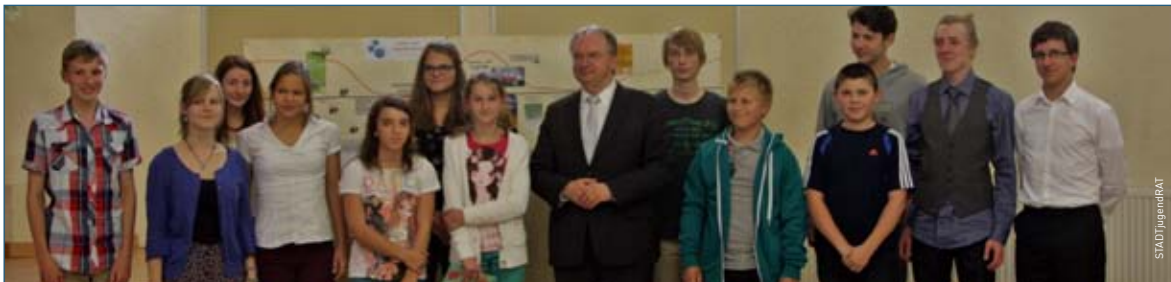
Ministerpräsident Dr. Reiner Haseloff besuchte den STADTjugendRAT in Hettstedt.