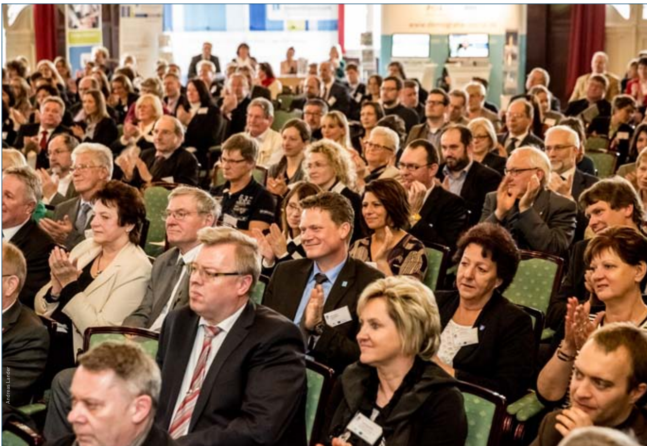
Teilnehmende verfolgen gespannt den 3. Demografie-Kongress Sachsen-Anhalt im Herrenkrug Park Hotel in Magdeburg.

Abwanderung? Diese und viele weitere Fragen spielten in den Gesprächen mit den jungen Leuten zentrale Rollen.